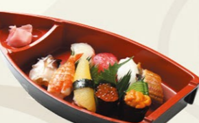
⑧にぎり(菊)きく 1,950円(税込)