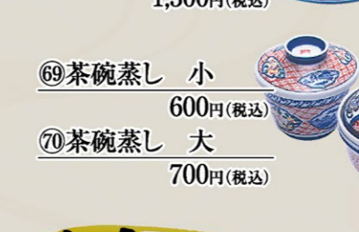
⑥⑨茶碗蒸し 小 600円(税込)