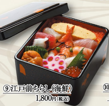
⑨江戸前ちらし(海鮮) 1,800円(税込)