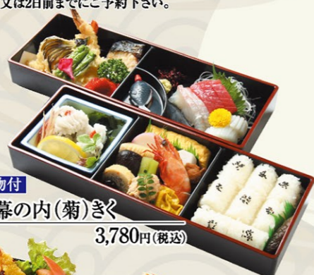
吸物付 ⑦⑦幕の内(菊)きく 3,780円(税込)