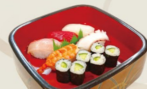
③にぎり細巻きセットA にぎり5貫と胡瓜巻(又は新香巻) 1,000円(税込)