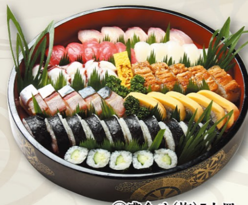
⑯盛合せ(梅)5人皿 6,000円(税込)