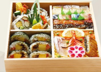
㉒すし折り(加賀)かが 4,000円(税込)