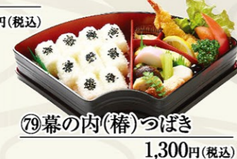
⑦⑨幕の内(椿)つばき 1,300円(税込)