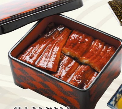
⑤⑨上うなぎまむし 2,100円(税込)