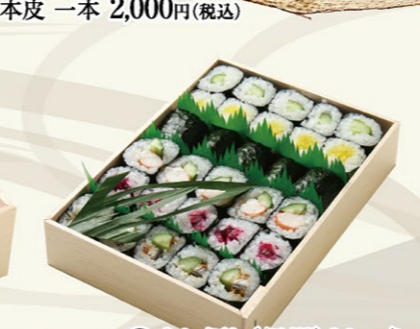
㉑すし折り(紀州)きしゅう 2,300円(税込)