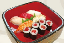
④にぎり細巻きセットB にぎり5貫と鉄火巻(又はうな胡巻) 1,200円(税込)