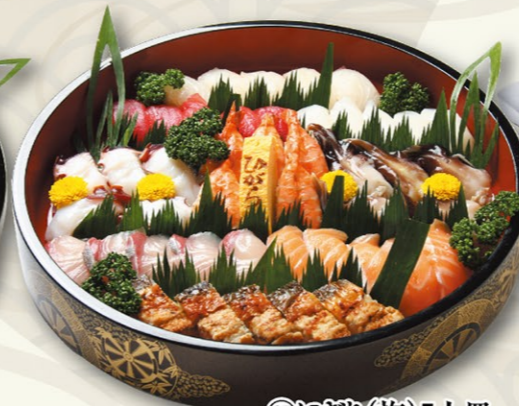
⑰にぎり(梅)5人皿 6,000円(税込)