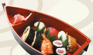
⑦盛合せ(菊)きく 上巻・細巻入り 1,620円(税込)