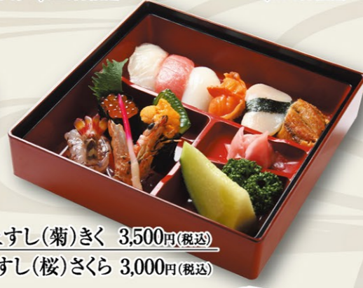
⑩上すし(菊)きく 3,500円(税込) 上すし(桜)さくら 3,000円(税込)