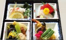
⑧⑦松花堂(鳴門)なると 吸物付 2,860円(税込)