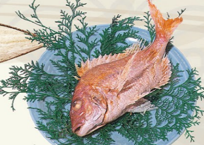
⑥⑤焼鯛約30センチ ※2日前までのご予約 3,500円(税込)より