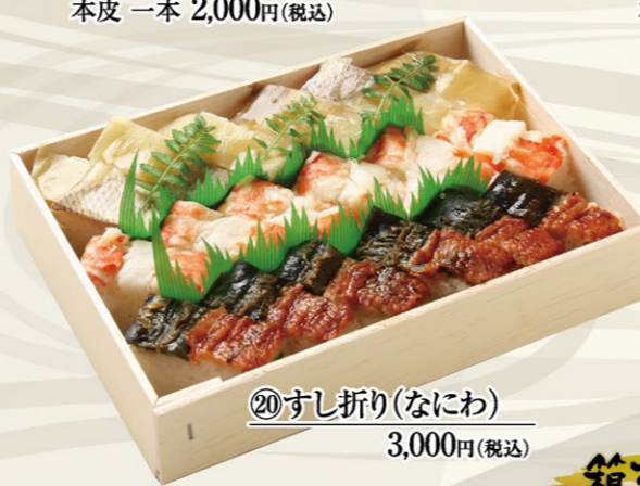
⑳すし折り(なにわ) 3,000円(税込)