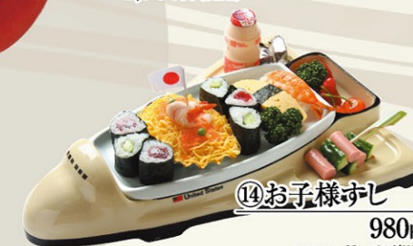
⑭お子様すし 980円(税込) ※アレルギーはご相談下さい。