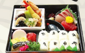
⑧①幕の内(梅)うめ にぎり4貫入り 1,620円(税込) 2,400円(税込)