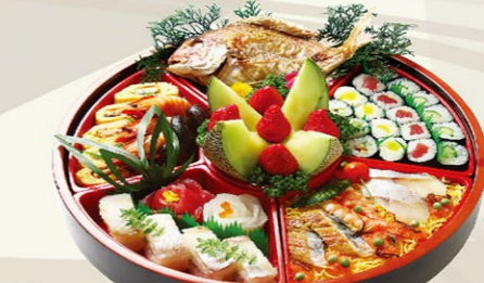
⑦②すしオードブル 7,000円(税込)

※2日前までにご予約下さい。 ○お誕生日・入園、入学、卒業、入社 ○七五三 ○初節句 ○御結納 ○御出産 ○合格、当選 ○金婚、銀婚 ○母の日、父の日 ○敬老の日、等々ご予約承ります