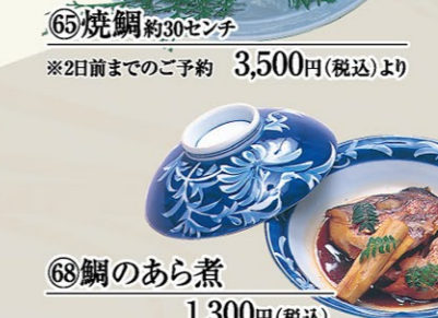
⑥⑧鯛のあら煮 1,300円(税込)