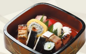
⑤盛合せ(梅)うめ 巻き・押し入り 1,200円(税込)