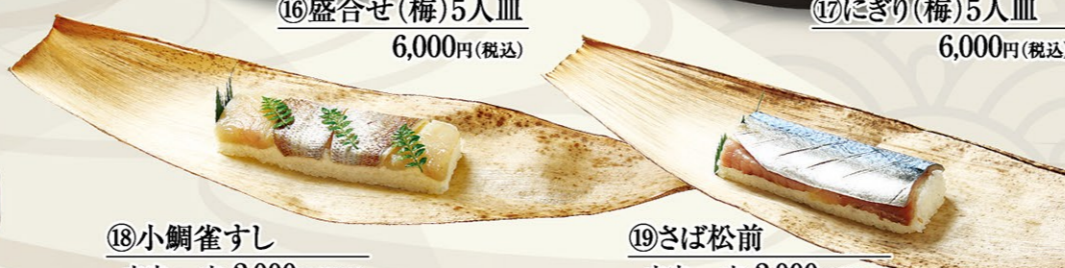
⑱小鯛雀すし 本皮 一本 2,000円(税込)