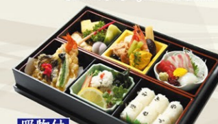
吸物付 ⑧①幕の内(萩)はぎ 4,320円(税込)