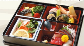
⑧⑥松花堂(高砂)たかさご 吸物付 3,300円(税込)