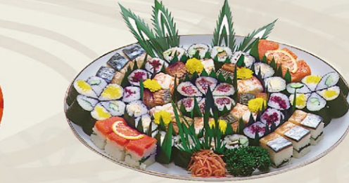
⑦③パーティー用すし盛 5,000円(税込)