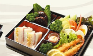
お子様向き ⑧③洋風弁当(ハワイ) ハンバーグ・エビフライ 1,800円(税込)