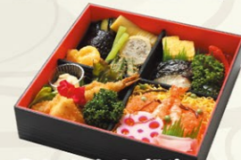
⑦⑧行楽弁当(楓)かえて (ちらし寿し) 1,840円(税込)