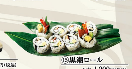
⑮黒潮ロール 1本 1,200円(税込)