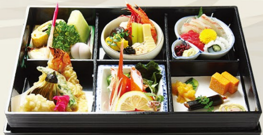
⑧⑤松花堂(利休)りきゅう 吸物付 5,400円(税込)