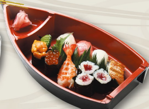
②上すし(梅)うめ 2,200円(税込)