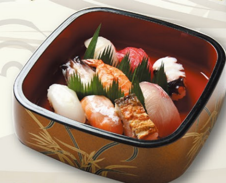
①にぎり(梅)うめ 1,200円(税込) にぎり(桜)さくら 1,400円(税込)